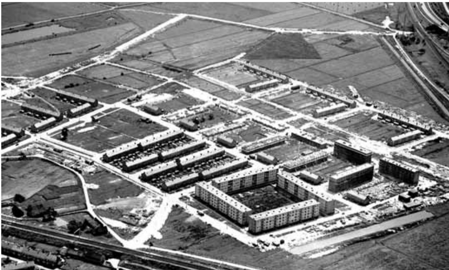
nieuwbouwwijk Presikhaaf in aanbouw.